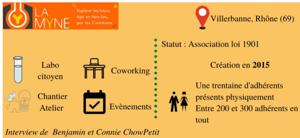
Figure 1 : Carte d'identité de la Myne

Le tiers lieu la Myne située dans une maison à Villeurbanne dans le département du Rhône est une association créée en 2014. La Myne est né dans le but de réaliser de la recherche scientifique en laboratoire citoyen indépendamment des laboratoires privés. Aujourd'hui, les activités de la Myne se sont largement diversifiées. En effet, la Myne réalise aujourd'hui du co-working, des chantiers, des ateliers et des évènements comme des conférences.